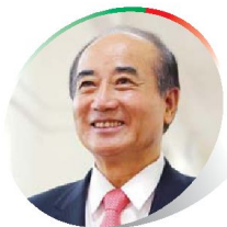
生策中心董事長 王金平

SNQ國家品質標章自創辦以來已發掘台灣生醫產業具品質和安全的服務、技術與產品，在產業間形成良性競爭和追求卓越發展的效應，同時集結台灣頂尖的醫療技術和豐沛的產業能量，奠定打造「大健康產業」新產業架構基礎，讓具備世界水準的「醫療」作為產業發展的核心動力和火車頭，帶動生技產業一起前進。