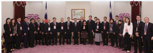
2018.2.9 陳建仁副總統接見國家生技醫療品質獎2017年得獎者，肯定得獎團隊提供優質醫療照護服務及高品質生技醫療產品